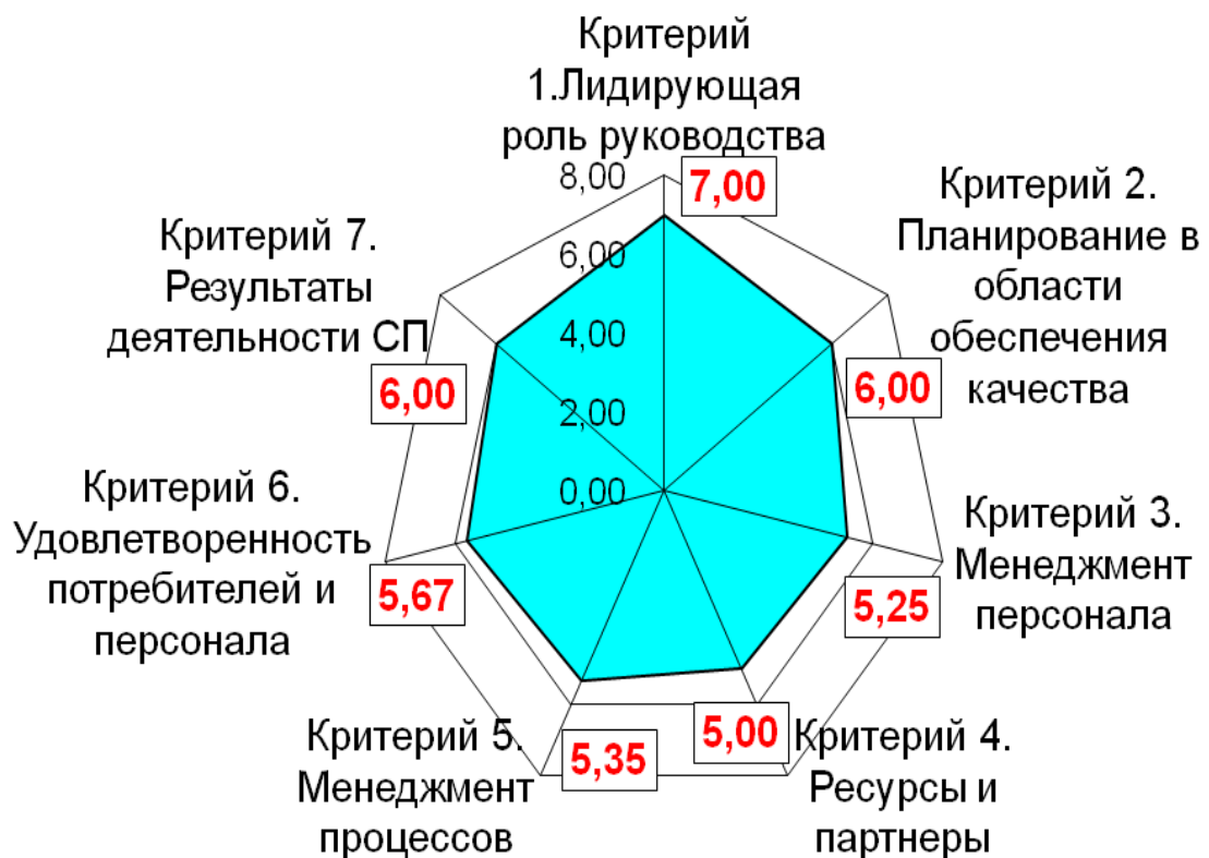
Лепестковая диаграмма № 1